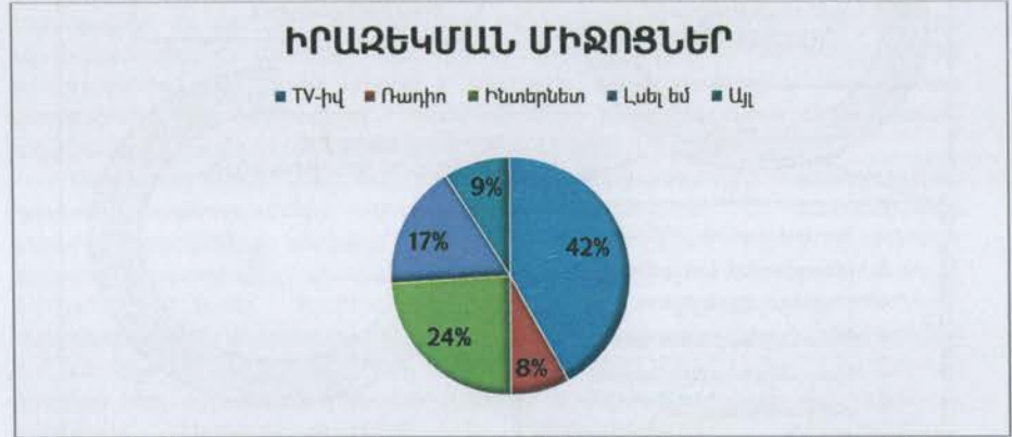
Նկար 3. Հաշտարարի գործունեության մասին իրազեկման աղբյուրները (n=65)

Հաջորդ՝ 3.3. «Հետազոտության արդյունքները և դրանց վերլուծությունը» վերտառությամբ ենթագլխում առանձնաբար ներկայացված են հետազոտության իրար հաջորդող փուլերում ստացված տվյալներն ու դրանց մեկնաբանությունը: Այսպես, 3.3.1. «ՀՀ-ում հաշտարարության ինստիտուտի կայացման և հասարակության իրազեկվածության վերլուծությունը» բաժնում ներկայացված է կատարված կոնտենտ վերլուծությունը, որն իրականացվել է երկու փուլով (ստացված տոկոսային ցուցանիշները ներկայացված են համապատասխանաբար առենախոսության հավելված 1-ում և 2-ում): Գիտափորձի մասնակիցների իրազեկման աղբյուրների գնահատման արդյունքները ներկայացված են նկար 3-ում: Ամենատարածված իրազեկման միջոցներն են՝ հեռու ստատեությունը՝ 42% և համացանցը՝ 24%: