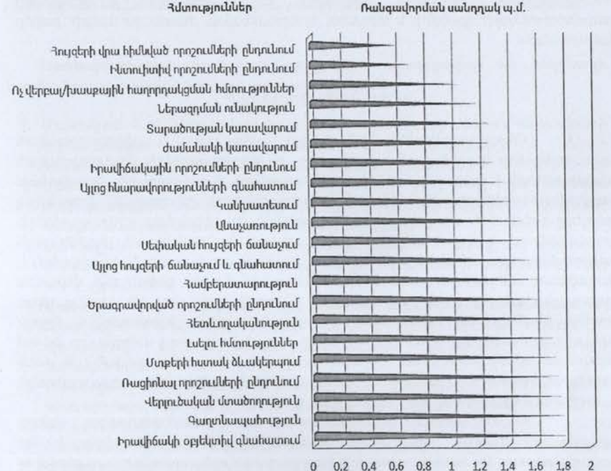
Նկար 4. Հաշտարարների մասնագիտական կարևոր հատկությունները (n=35)

հաղորդակցման հմտությունները, ֆիզիոգնոմիկան, վարքը, կրթությունը և այլն: Անձնային առանձնահատկություններին նույնպես հատուկ անդրադարձ չի կատարվում: ՀՀ-ում հաշտարարների մասնագիտական կարևոր հատկությունների ուսումնասիրման, և, որպես հետևանք, հաշտարարի հոգեբանական դիմանկարի կազմման նպատակով մեր կողմից իրականացված փորձագիտական հարցման հիման վրա կատարվել է նաև հատկությունների և ունակությունների ուսնգավորում (նկար 4):