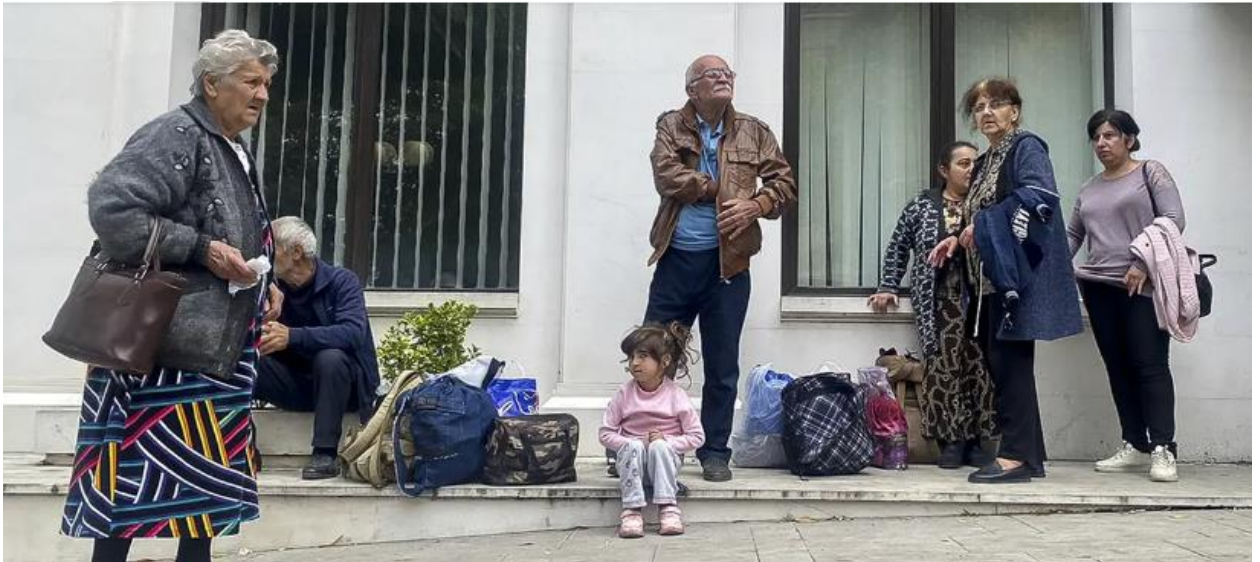
Generaldebatte in New York