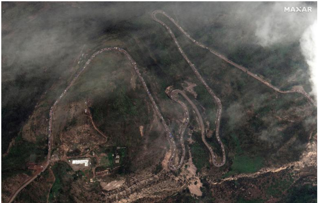
Tausende von Armeniern sind aus Bergkarabach geströmt, nachdem das aserbaidische Militär die Kontrolle über die Region zurückerlangt hatte

Bereits einen Tag später erklärten die dortigen pro-armenischen Kämpfer ihre Kapitulation.